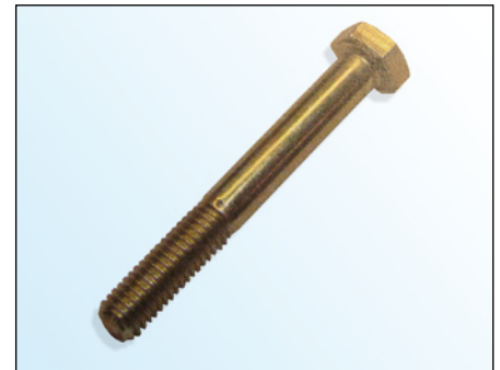
Fig. 2: Tornillo OE

En el marco del desarrollo continuo de nuestros productos y de la seguridad de la calidad INA suministra con la polea tensora 531 0274 30 un nuevo tornillo (fig. 3).