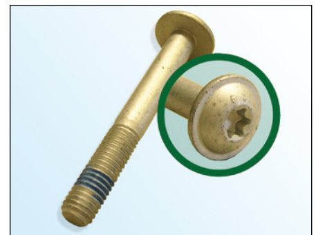
Fig. 3: Tornillo INA

INA recomienda cambiar el tornillo original (fig. 2) por el tornillo suministrado.