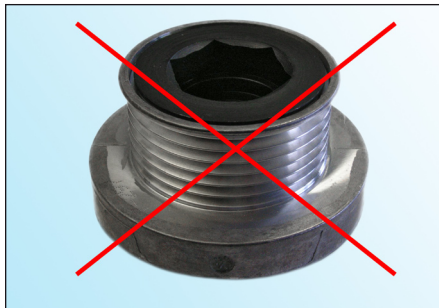
Imagen 1: 535 0117 10

El amortiguador de oscilaciones con Referencia 535 0117 10 (Imagen 1) ha sido sustituido por el artículo con Referencia 535 0105 10 (Imagen 2).