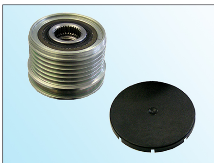
Imagen 2: 535 0105 10

El amortiguador de oscilaciones con Referencia 535 0117 10 (Imagen 1) ha sido sustituido por el artículo con Referencia 535 0105 10 (Imagen 2).