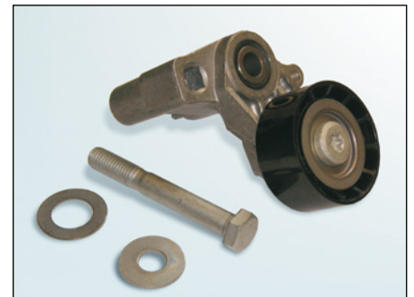
Fig. 2: 534 0100 20 - Versión anterior

¡Observar las indicaciones del fabricante del vehículo!