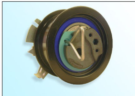
Fig. 1: 531 0565 30 (versión antigua)

Esta información de servicio destaca las características visuales entre la versión antigua y la versión nueva.