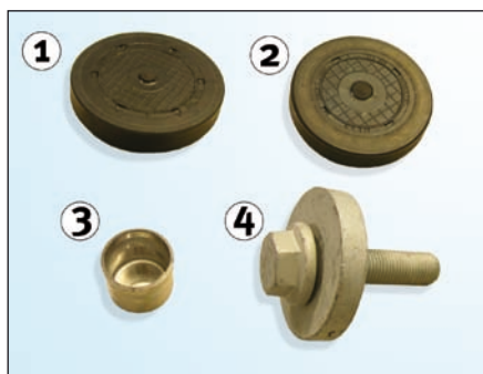
Imagen 1: Suministro

Nº OE: • 530 0092 10 77 01 471 974 • 530 0192 10 77 01 476 674 • 530 0193 10 77 01 472 696 • 530 0342 10 77 01 476 675 • 530 0415 10 77 01 474 359